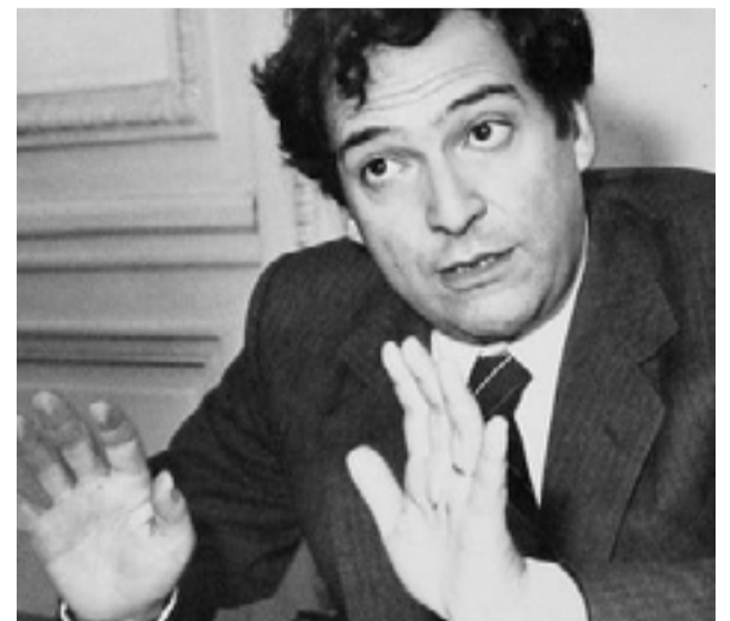
Carlos Santiago Nino

Todo ello a pesar de que la propia constitución contiene un mandato de deliberación en su artículo 22: leído en sentido positivo dicha norma indica que los representantes del pueblo “deliberan” o, mejor dicho, el pueblo delibera por medio de sus representantes. Vale decir, el sistema representativo bien puede –y debe ser– entendido como orientado a maximizar las condiciones deliberativas de los procesos de toma de decisión en los distintos estamentos del régimen político del Estado. Y, además, tiene la elasticidad suficiente como para convivir con arreglos institucionales que supongan la inclusión de mecanismos deliberativos, con amplia participación de los potenciales afectados por las decisiones de políticas públicas, con las demás condiciones detalladas más arriba y con incidencia real en la toma de decisión.